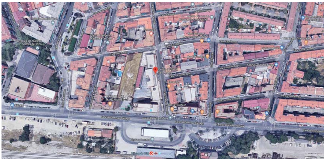
SITUACION VISTA AEREA